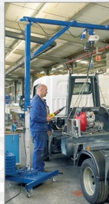
Použití minijeřábu Quickmax při práci v autodílně