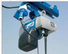
Reflexový světelný signál zavěšený na jedním čepu