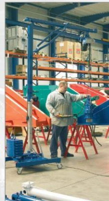
Použití minijeřábu Quickmax na dílně při opravě převodové stavebního stroje