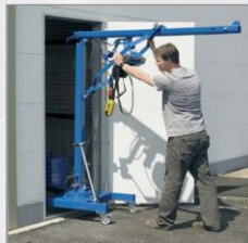
Stavba prostorové síť vřadiny stavebního otvoru