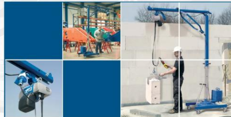
Víceúčelový minijáb pro snadné zvedání malých břemen