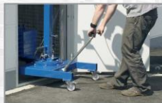
Rychlá a snadná přemístění